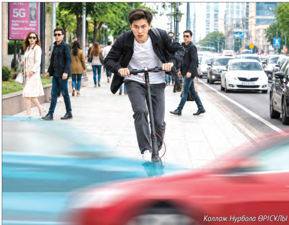
Коллаж Нурбола ӘРІСҰЛЫ

– Некоторые наши курьеры действительно не имели водительских прав, но теперь мы потребовали всех привести документы в порядок. Теперь и водители мотобусов стали регистрировать свои