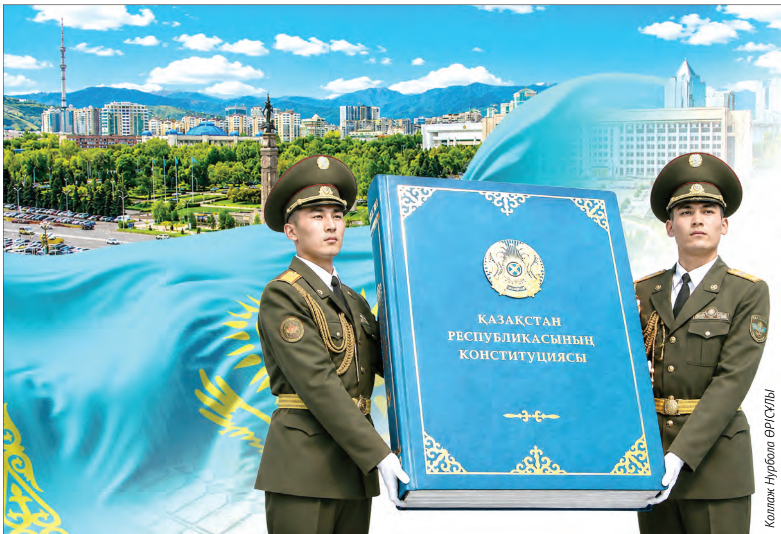
Коллаж Нурбола ӘРІСҰЛЫ

Следующим шагом стало создание Конституционной комиссии, объединившей 130 представителей самых разных сфер от юристов и ученых до общественных деятелей, журналистов и представителей регионов Казахстана.