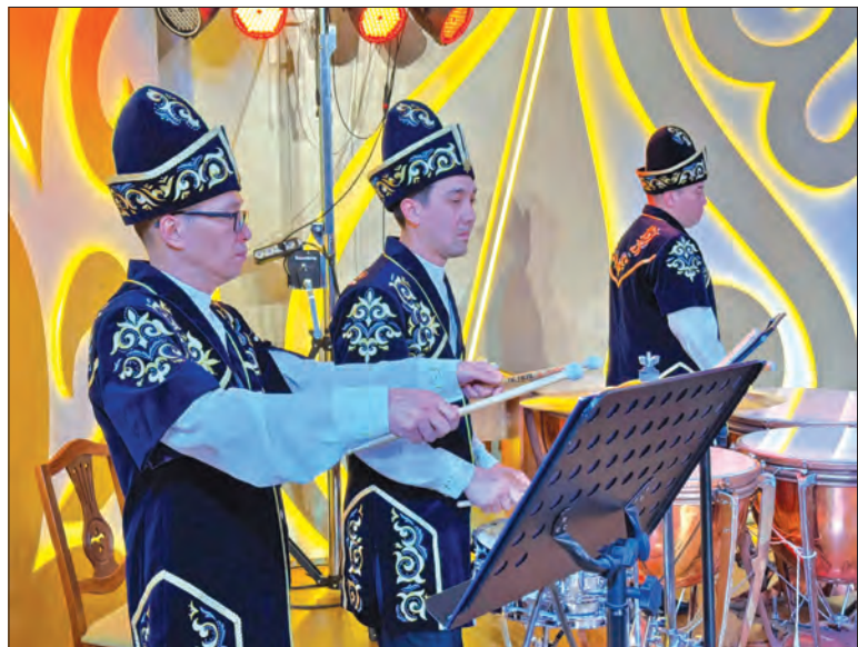
В Алматы прошел вечер памяти выдающегося казахского композитора и дирижера Каршыги Ахмедиярова